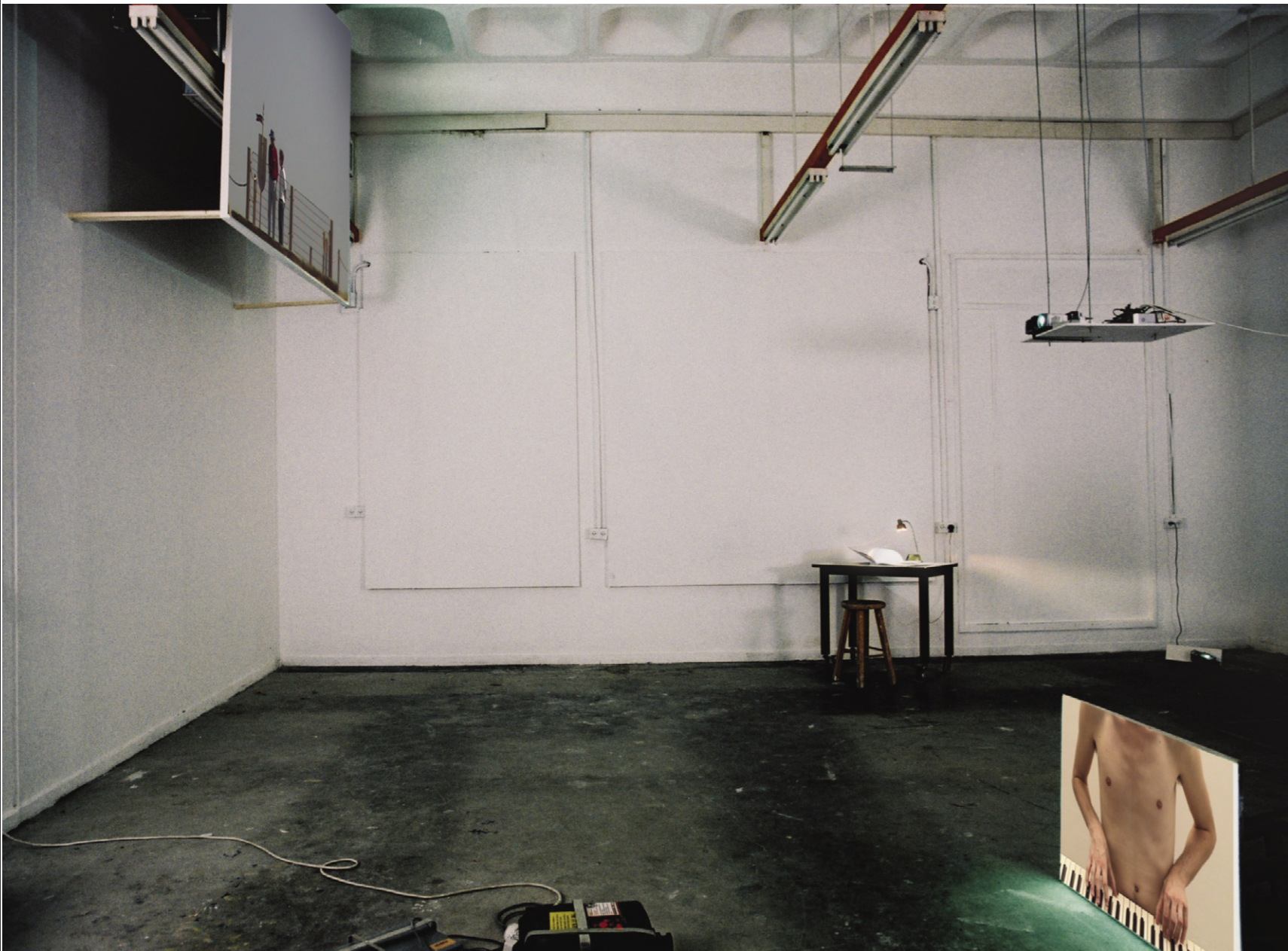
טליה קינן, מיצב, 2005, תערוכת בוגרים MFA, בצלאל; מימין למעלה: ללא כותרת, עיפרון על נייר, 2005, A4; מימין למטה: ללא כותרת, טכניקה מעורבת על נייר, 2005, A4